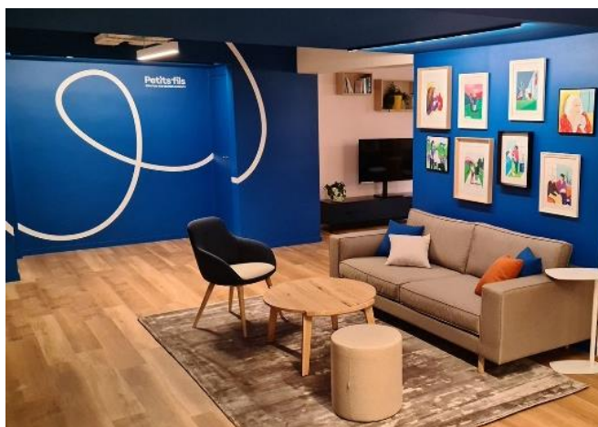
Espace détente des collaborateurs

Les nouveaux locaux de Petits-fils au 183 rue de Javel, 75015 Paris