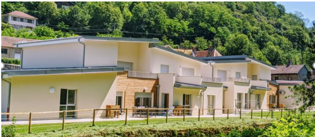
Maison Ages&Vie ouverte en 2021 à Beure

A la mi-année 2021, Ages&Vie est en ligne avec son plan de développement ambitieux. 17 nouveaux projets en VEFA (vente en l'état futur d'achèvement) viennent ainsi d'être signés par la Foncière Ages&Vie. Cette SCI, créée en mai 2019, en partenariat avec Korian, la Banque des Territoires (qui en détient 35%) et Crédit Agricole Assurances (35%), soutient le développement immobilier du réseau de maisons Ages&Vie. Les 17 projets signés portent à 87 l'ensemble des projets de cette foncière, soit plus de la moitié des quelque 150 qui seront réalisés au total sur l'ensemble du territoire français.