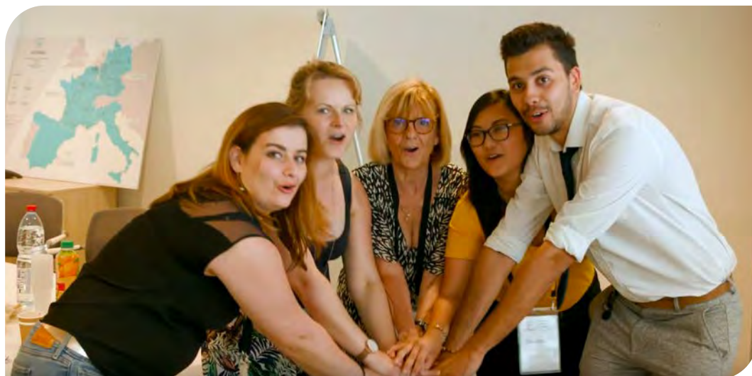
Des apprentis directeurs d'établissement lors d'une journée de travail collaboratif.

Pour voir les séances d'intégration des apprentis directeurs, cliquer ici