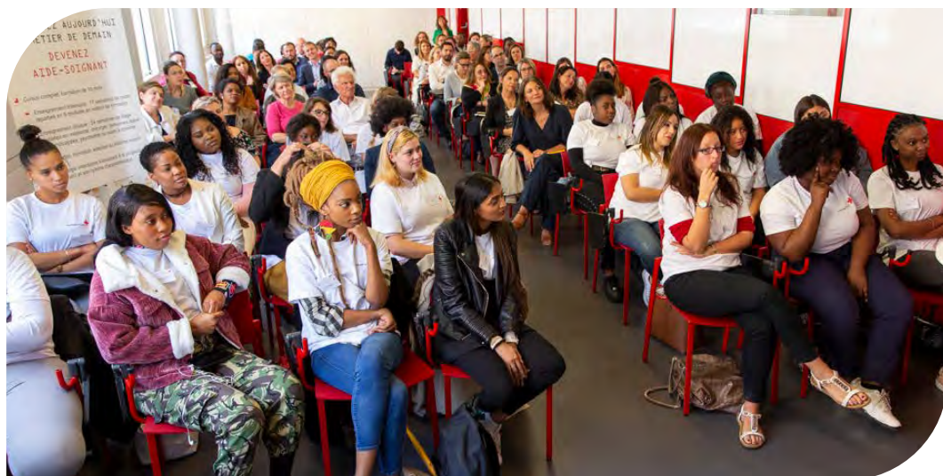
Classe Korian d'apprentis aides-soignants

Depuis le 4 janvier 2021, le Centre de Formation des Apprentis (CFA) des métiers du soin , porté par la KORIAN ACADEMY accueille ses 19 premiers apprentis aides-soignants en région parisienne au sein de l'Institut de Formation des Aides-Soignants (IFAS) d'ASSISTEAL Paris. L'objectif est d'accueillir 180 apprentis supplémentaires à la prochaine rentrée, en septembre 2021. La création de ce CFA complète la politique très active de Korian en matière d'apprentissage déjà engagée depuis 2018. et portera le nombre d'apprentis Aide-Soignants Diplômés d'État à 500 en 2021.