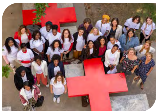
Les apprentis de la classe Korian formés avec la Croix-Rouge (2019)

En 2019, Korian et la Croix-Rouge ont noué un partenariat pour favoriser la formation et le recrutement d'aides-soignants et d'infirmiers dans les métiers du Grand Âge.