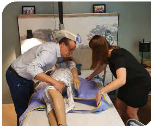
Apprentissage des bons gestes dans la chambre de simulation.